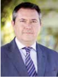
Juan Espadas Cejas Alcalde de Sevilla

Avanzar y progresar en sociedad implica hacer esfuerzos por integrar y cohesionar, sin dejar a nadie atrás. Por ello debemos derribar barreras de todo tipo, no solo en aspectos sociales y económicos, sino también en lo referente a barreras cognitivas.