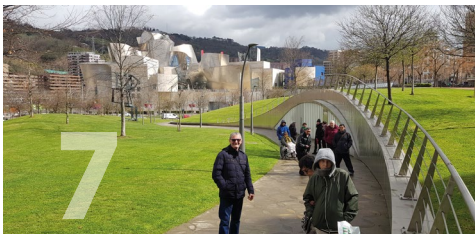
7. Guggenheim Grupo envejecimiento