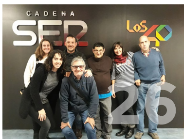
26. Mucho que contar Programa envejecimiento