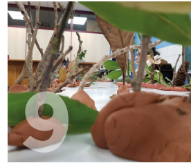
9. Bosque Taller de barro