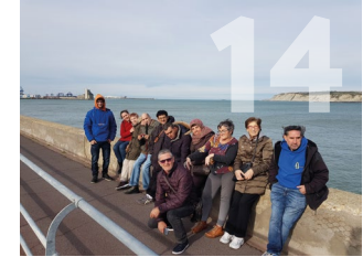
14. Lo que el viento se llevó Grupo envejecimiento