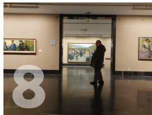
8. Museo de Bellas Artes Blas Santua