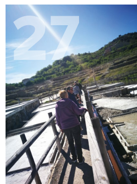
27. La luz, la sal Grupo envejecimiento